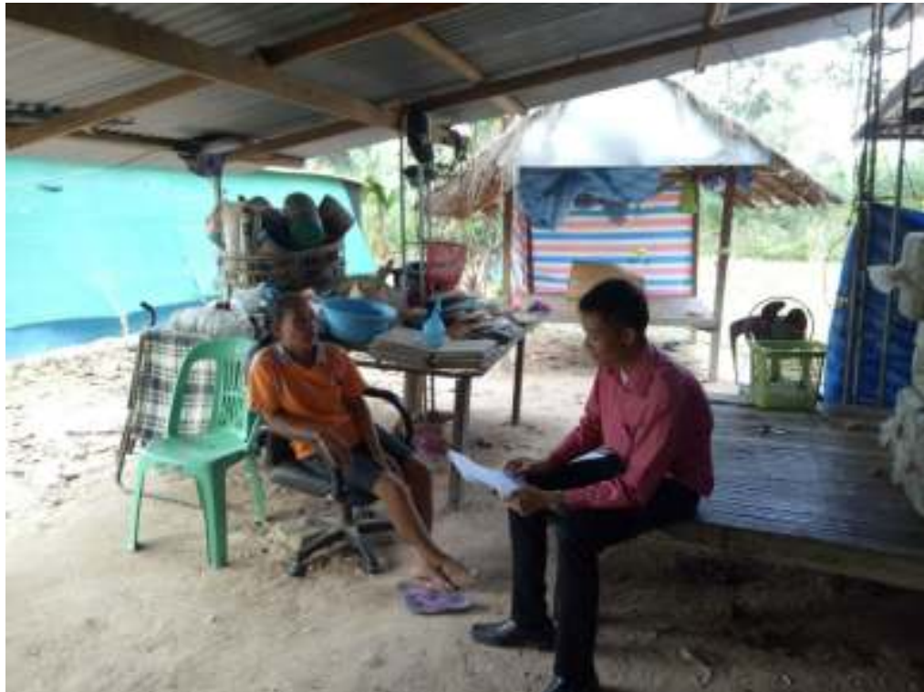
ภาพกิจกรรมการออกสำรวจความคิดเห็นของประชาชนในพื้นที่ตำบลพระเสารี่