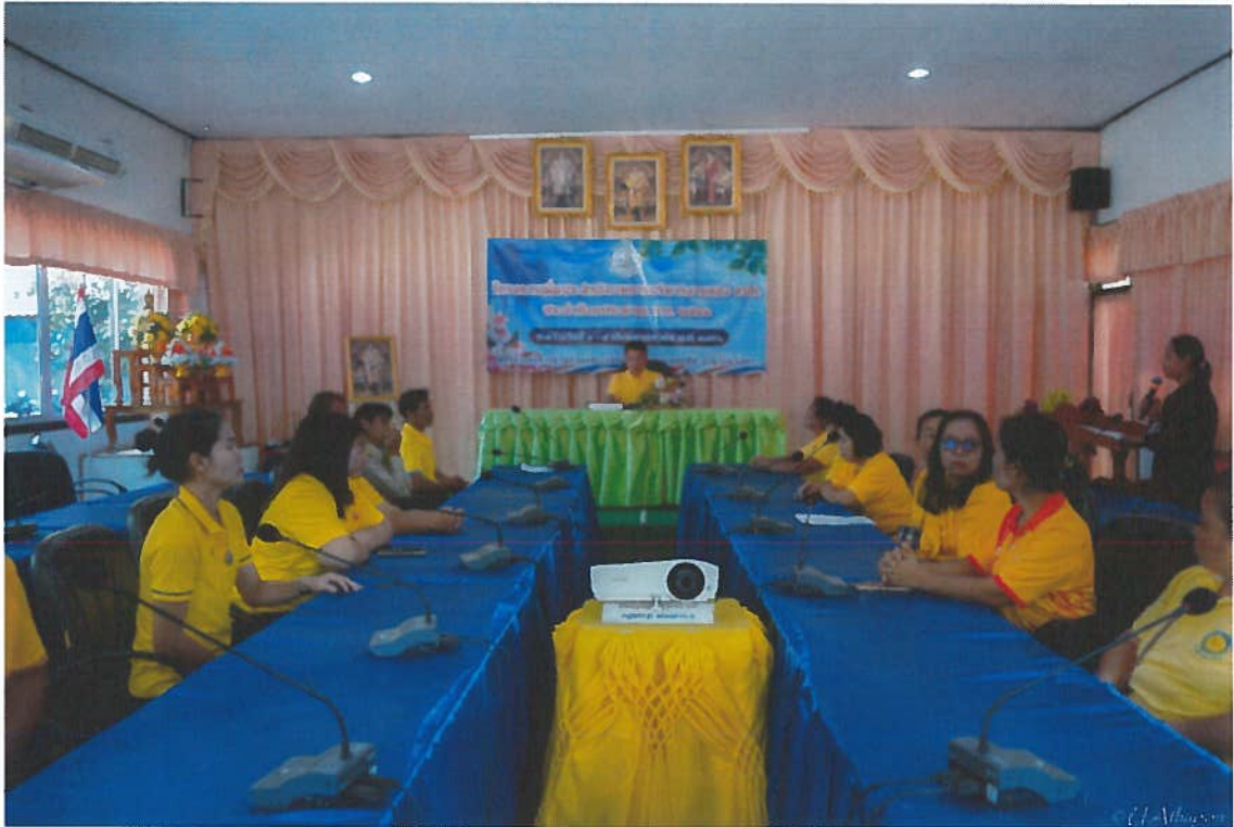
รูปภาพประกอบโครงการเพิ่มประสิทธิภาพการบริหารงานของ อบต. ประจำปีงบประมาณ พ.ศ. 2566 ระหว่างวันที่ 1-4 พฤษภาคม 2566